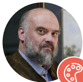
АНДРИЯКА СЕРГЕЙ НИКОЛАЕВИЧ

Народный художник Российской Федерации, действительный член Российской академии художеств, ректор Академии акварели и изящных искусств, художественный руководитель Школы акварели