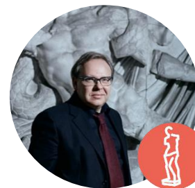
МИХАЙЛОВСКИЙ СЕМЕН ИЛЬИЧ

Ректор Санкт-Петербургского государственного академического института живописи, скульптуры и архитектуры имени И. Е. Репина при Российской академии художеств, действительный член РАХ, лауреат премии Правительства России