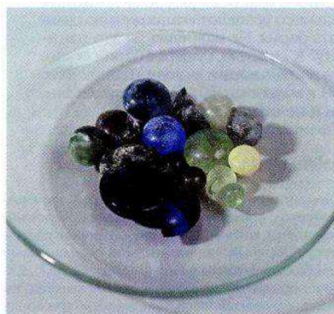
Рис. 1.2. Качественные реакции ионов металлов по окраске перлов

Флавицким Ф. М. (1898) предложен метод растирания твердого анализируемого вещества с твердым реактивом. Метод применим в тех случаях, когда при растирании порошков образуются окрашенные соединения или выделяются газообразные вещества. Например, при растирании в фарфоровой ступке нескольких кристаллов \text{CoSO}_4 с твердым \text{NH}_4\text{SCN} появляется синяя окраска комплексной соли (\text{NH}_4)_2[\text{Co}(\text{SCN})_2\text{SO}_4] :