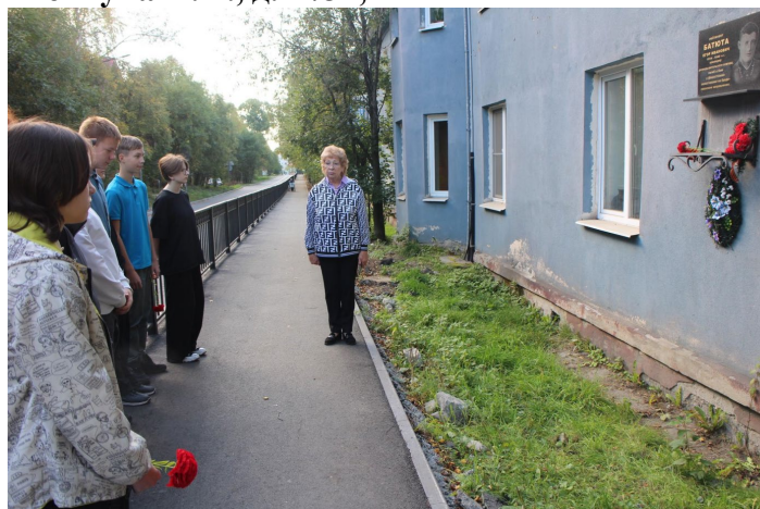
мемориальная доска Шевчуку П.И. (Капитан Шевчук Петр Иванович героически погиб в боях с немецко-фашистскими захватчиками на Кандалакшском направлении в сентябре 1944 г.) - ул. Чкалова, д.39,